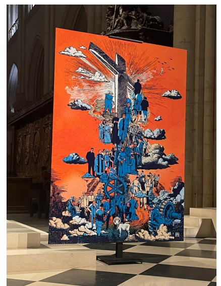
Gemälde in der Notre Dame de Paris zur Feier der Seligsprechung der 50 Märtyrer