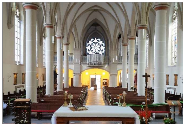
Blick auf die Orgelempore

Die erste Orgel wurde schon 1903 von der Barmer Firma Paul Faust eingebaut und 1935 als elektropneumatische Pfeiffenorgel mit drei Manualen und 40 Registern erweitert. 1978/79 wurde sie von der Firma Schwelmer Orgelbau grundlegend überholt. Der Originalzustand ist leider nicht mehr rekonstruierbar.